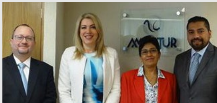
17 de Enero de 2017 RECONOCIMIENTO TURÍSTICO 2017 Reunión con la Entidad Mexicana de Acreditación para conocer las bases del RECONOCIMIENTO TURÍSTICO 2017.