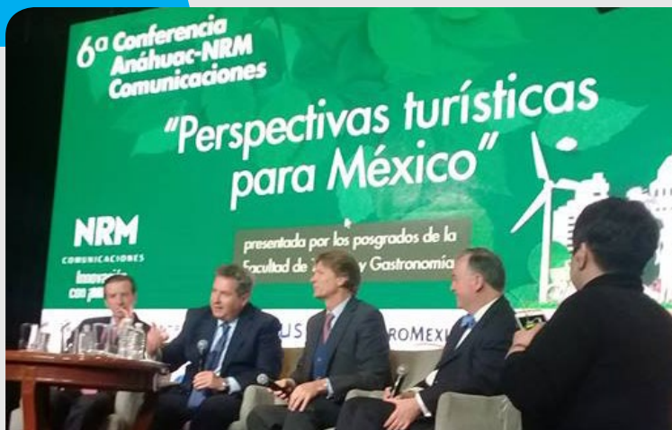
11 de Enero de 2017 6ª CONFERENCIA ANÁHUAC-NRM COMUNICACIONES "PERSPECTIVAS TURÍSTICAS PARA MÉXICO"