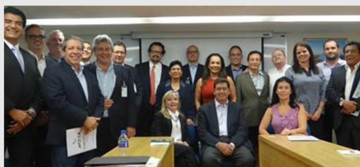
25 de Enero de 2017 XXX ASAMBLEA GENERAL ORDINARIA AMDETUR

En la 6ª Conferencia Anáhuac-NRM Comunicaciones "Perspectivas Turísticas para México".