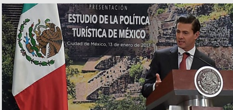
13 de Enero de 2017 ESTUDIO DE LA POLÍTICA TURÍSTICA DE MÉXICO. OCDE - SECTUR.

El Lic. Enrique Peña Nieto habló de las fortalezas del turismo en México y agradeció a su gabinete y al sector empresarial por los esfuerzos obtenidos. Finalmente dijo que el activo más importante de México en el turismo, somos los mexicanos.