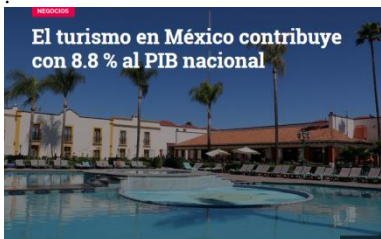
El turismo en México contribuye con 8.8 % al PIB nacional

El Secretario criticó que las obras del anterior proyecto aeroportuario, el NAIM, bucarán por un lado eliminar una zona que regula los hundimientos en la Ciudad de México y por otra duplicar las obras. "Era más fácil triplicar obras y hacerlas en forma más a la ligera, a mi juicio, hasta irresponsable, porque el mantenimiento hubiera salido muy caro y además las pistas movidas en 45 grados apuntando al lago Nabor Carrillo ponía en riesgo también", consideró Torruco.