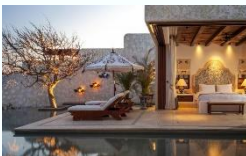
Certificación Turística de Sectur.