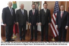
El secretario de Relaciones Exteriores, Miguel Alemán, con el secretario de Estado de E.U., Rex Tillerson, en un momento de la recepción en el Palacio Nacional.

“No se usará al Ejército para operaciones migratorias ni habrá deportaciones masivas, éstas se realizarán de forma sistemática, ordenada y segura, respetando los derechos humanos de los inmigrantes y dando prioridad a quienes tengan antecedentes penales”, aseguró el secretario de Seguridad Nacional de Estados Unidos, John Kelly. Tras una reunión de casi tres horas en la Cancillería mexicana y en un mensaje a los medios con los titulares de las secretarías de Gobernación (Segob) y de Relaciones Exteriores (SRE), Miguel Osorio y Luis Videgaray y, con el secretario de Estado de EU, Rex Tillerson, las partes reconocieron que la relación entre los países pasa por un momento complejo por los “agravios y desencuentros” de las últimas semanas.