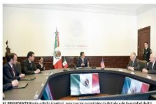
El presidente Enrique Peña Nieto, con los secretarios de Estado y de Seguridad de E.U.

El Presidente Enrique Peña aseguró que México negociará con Estados Unidos de manera integral siempre con “un posicionamiento firme” y en favor de los intereses de nuestro país. Tras recibir en Los Pinos a los secretarios de Estado y de Seguridad Nacional estadounidenses, Rex Tillerson y John Kelly, el primer mandatario reiteró que, para el Gobierno de México, la protección de los mexicanos en Estados Unidos y el respeto a sus derechos es una de las mayores prioridades de su gobierno.