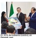
EL JEFE de Gobierno (centro), en Panamá, ayer.