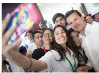
EL PRESIDENTE Enrique Peña en la COP13...

Una histórica declaratoria de reservas de áreas naturales decretó ayer el Presidente Enrique Peña en Cancún, Quintana Roo, durante la cumbre de las Naciones Unidas por la biodiversidad (COP 13), que reúne a representantes de 190 países en ese destino turístico. Se trata en total de 91 millones de hectáreas, terrestres y marítimas (70 millones que protegen zonas marinas y 21 millones, zonas terrestres), que significan casi el doble de la superficie de Francia o España, zonas que estarán vedadas a la exploración y extracción de hidrocarburos, y es la máxima superficie que algún gobierno mexicano haya decretado.